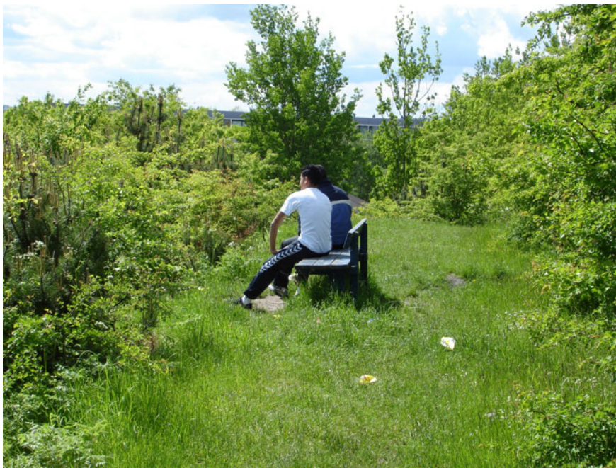
Bænkenes placering har indflydelse på, hvad de benyttes til.

Rundt i boligområderne er der placeret en række bænke samt borde- og bænkesæt. Her mødes de unge tit for korte eller længere ophold. Nogle bænke er mere attraktive end andre, og placeringen er af betydning for hvilke aktiviteter, der foregår omkring bænke. De bænke, som står langs stierne og med frit udsyn fra lejlighederne, benyttes til småsnak eller som mødested for at gå videre, mens de bænke, som ligger længere væk fra lejlighederne og er afskærmet, benyttes til længere ophold. Her vil der udover almindelig snak og socialt samvær også være mulighed for at foretage sig aktiviteter, der er knap så velanset af de unges forældre som for eksempel at ryge cigaretter og hash. Ifølge områdemedarbejderne kan de unges ophold på bænke langs de befærdede stier for nogle af beboerne virke generende og utrygt, specielt hvis de unge kommer med tilråb o.lign., hvad de godt kan finde på engang imellem.