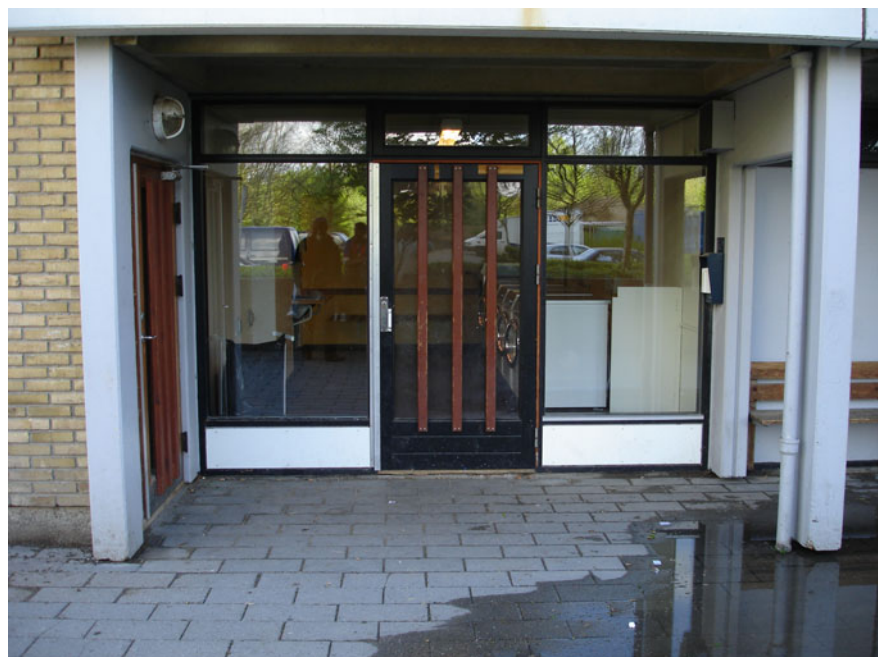
Et af ungdommens foretrukne steder kan i en periode være foran vaskeriet.

I tillæg til de beskrevne steder, som ungdommen anvender, eksisterer der steder som ungdommen selv tager i besiddelse. Det er de unges egne steder, og som henviser til steder, som godt nok er steder for ungdommen, men som ikke er steder bestemt for specifikke funktioner eller formål set ud fra gængse voksennormer. Disse steder kan være faste tilholdssteder over en længere periode eller det kan være steder, der benyttes i en kortere periode.