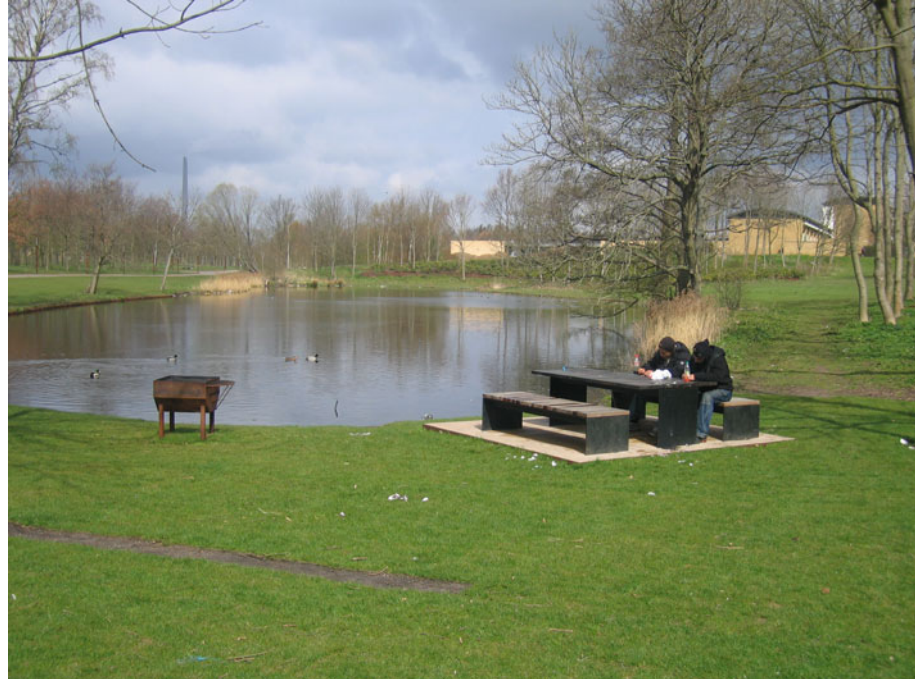
De unge er storforbrugere af de grønne områder.

fri for den stærke sociale kontrol, som de synes er gældende i de nære omgivelser inde i boligområderne.