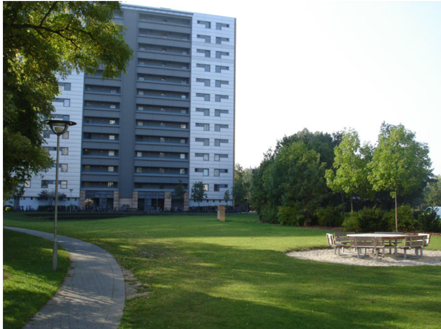
Her er det muligt for piger og drenge at mødes.

Både drengene og pigerne er godt tilfredse med udemiljøet i bebyggelsen. Begge køn anvender de bænke, der findes i området og inde imellem boligblokkene findes der nogle åbne, grønne fællesarealer, hvor de kan spille bold eller mødes med hinanden.