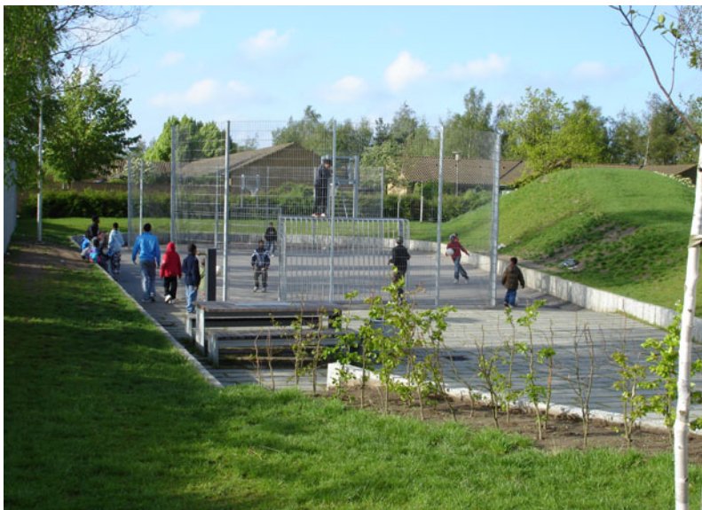
Mindre idrætsanlæg placeret rundt i boligområderne er meget populære.

Udover legepladserne findes der forskellige steder i boligområderne forskellige former for mindre og større anlæg til boldspil. Disse boldbaner er meget attraktive for de unge og benyttes især til fodbold og til en vis grad basketball, som er de to boldspil, som er de mest foretrukne. Det er bemærkelsesværdigt, at mange unge piger ofte er med til både fodbold og basketball. Udover at boldbanerne fungerer som aktivitetssted er de også mødesteder for de unge. Meget af tiden går med at være til stede, se på og være en del af fællesskabet. Det er tydeligt, at boldbanerne er et sted, som også er legalt for pigerne at opholde sig, også i samvær med drengene.