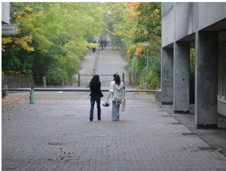
Stierne spiller en betydelig rolle i de unges udlev.

I tilknytning til boligområderne (Vollsmose og Gellerup) findes en lokal grillbar. Her er der en del trafik til og fra af områdets beboere, men det er også her, at en del unge handler, mødes eller hænger ud i kortere og længere tid. Det gælder ikke mindst om aftenen, hvor 'grillen' er åben, og hvor der også er mulighed for at træffe det modsatte køn.