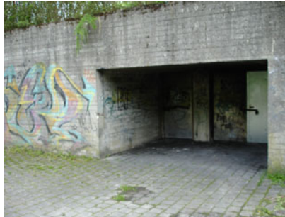
Eksempler på ungdommens egne steder