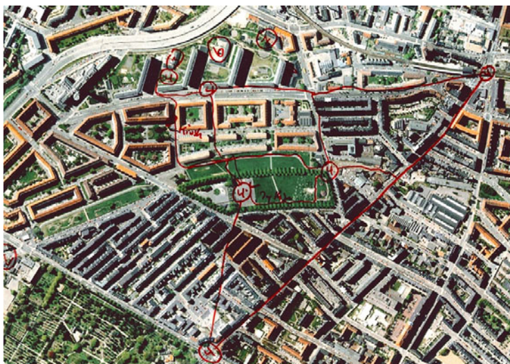
De unge fik udleveret et lamineret luftfoto, hvor de indtegnede deres ruter og opholdssteder.

Der blev ikke anvendt båndoptager under gåturene med de unge. De unges fortællinger om hverdagsliv og udeliv i boligområderne blev derfor umiddelbart efter gåturene nedskrevet i resuméform.