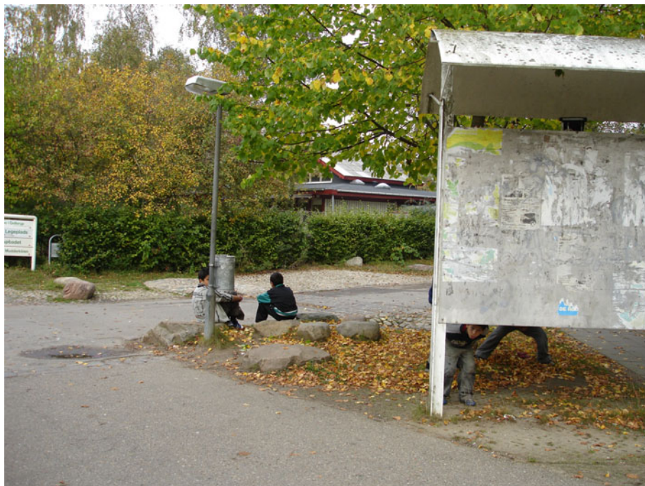
Gadehjørner er ofte attraktive møde- og opholdspladser.

De mødes på hjørnet, der hvor stien drejer, der er et par bænke. Og henne ved Dortesvej nede ved bumpet, det ser åndsvagt ud, men der er tit masser af drenge. Men det er dét med at stå, hvor alting går forbi. Det er bare en sådan lyskasse. (Områdemedarbejder).