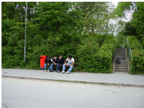
Et sted - som for eksempel en bæk - er både et socialt og fysisk rum.

Et sted er i vores undersøgelse det overordnede begreb for en hel række mere specifikke funktions- og relationsdefinerede steder som for eksempel stier, møde- og opholdspladser, gadehjørner, legepladser, opgange, bænke osv. Som det vil fremgå af vores analyse af ungdommens steder i de tre udvalgte boligområder, er det et karakteristisk træk, at de unge benytter mange forskellige typer af steder - formelle som uformelle -, og at disse appellerer til forskellige former for aktiviteter, sociale funktioner og adfærd.