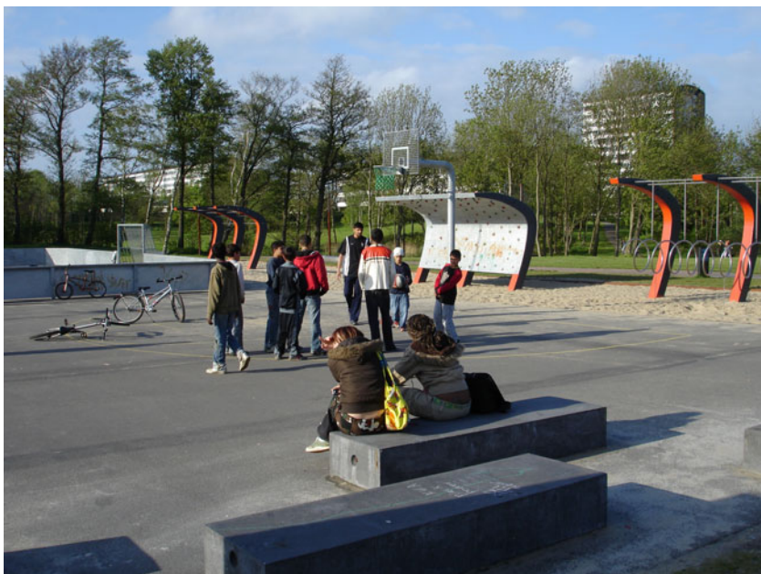
Steder til fysisk aktivitet er tiltrækkende på de unge.

Fysiske indsætser i udemiljøet i boligområder kan have en positiv og befordrende virkning på de unges holdning til nærmiljøet og udemiljøet i sin helhed. Etableringen af for eksempel boldbaner, synes at have betydning for udvikling af sociale netværker internt i området såvel som eksternt. Idrætsaktiviteter kan trække andre unge til området. Det kan skabe relationer udadtil og kan således bidrage til at styrke den sociale kapital i boligområdet - både den afgrænsende og den brobyggende.