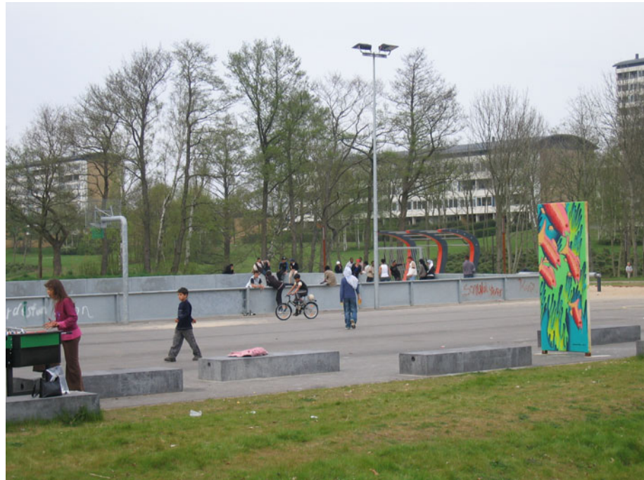
Idrætslegepladsen i Vollsmose. Et aktivitets- og samlingssted for både piger og drenge.

Som noget unikt ligger der midt i Vollsmose en stor grønt, kommunalt parkområde. De seneste år er der sket en række nye kommunale tiltag og indsatser. Nye stier er anlagt, søerne er blevet rensset, det grønne er blevet beskåret, grillpladser er blevet placeret rundt i området, og ikke mindst er en ny meget populær idrætslegeplads blevet anlagt. Dette parkområde benyttes flittigt af beboerne, de lokale skoler og børnehaver - og ikke mindst af de unge.